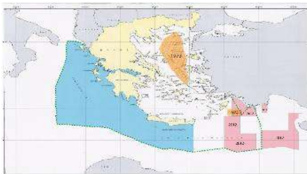
Χάρτης με ζώνες ελληνο-τουρκικών υποθαλάσσιων ερευνών 63

Όπως προκύπτει από την ως άνω ανάλυση, μια τυχόν προσπάθεια της Ελλάδας να ανακηρύξει μονομερώς της ΑΟΖ προσκρούει προδήλως στις τουρκικές αντιδράσεις, αλλά και στην εμπλοκή του διεθνούς παράγοντα. Είναι προφανές ότι το εν λόγω ζήτημα ξεπερνά τα όρια της παραδοσιακής ελληνοτουρκικής διαμάχης και εντάσσεται σε ένα ευρύτερο πλαίσιο διεθνών σχέσεων που αφορά την ενεργειακή ασφάλεια της Ευρώπης και την σταθερότητα στην Ανατολική Μεσόγειο. Η παρούσα συγκυρία, λοιπόν, όπου Ελλάδα και Κύπρος ταλανίζονται από την οικονομική κρίση φαίνεται να είναι ιδιαίτερα αρνητική για ανάληψη ριζοκίνδυνων πρωτοβουλιών, ενώ η γενικότερη αλλαγή των ισορροπιών στη μέση